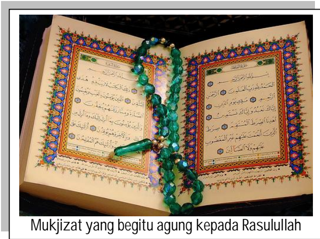
Mukjizat yang begitu agung kepada Rasulullah

Al Quran merupakan kitab wahyu yang diturunkan oleh Allah kepada rasulNya yang mulia Muhammad s.a.w lebih empat belas abad yang lalu. Ia diturunkan secara berperingkat-peringkat memakan